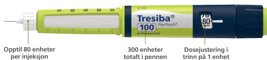
Tresiba® FlexTouch® 100 enheter/ml ferdigfylt penn