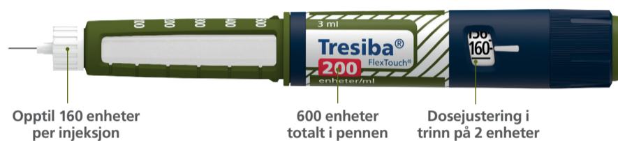
Tresiba® FlexTouch® 200 enheter/ml ferdigfylt penn