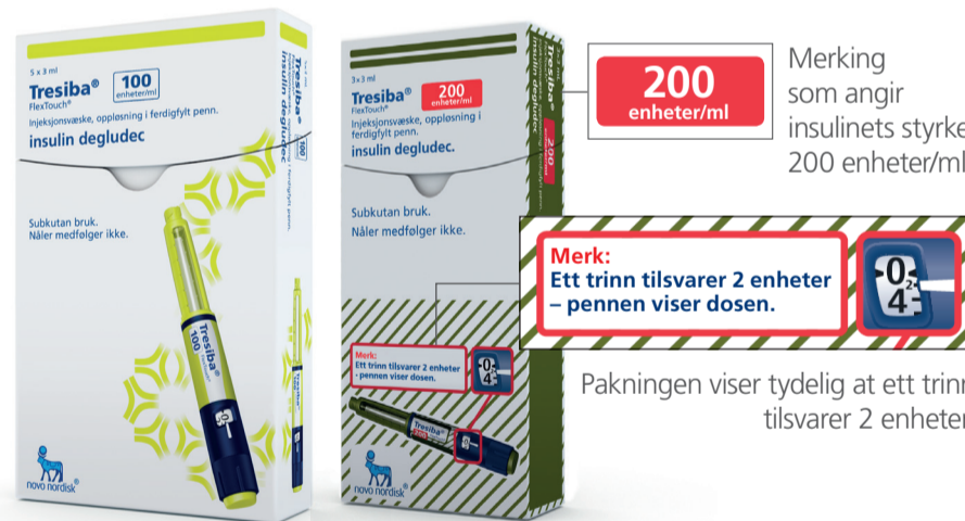
Tresiba® FlexTouch® 200 enheter/ml pakning med 3 penner

Ingen omregning av dosen skal foretas – den ferdigfylte pennen viser dosen i enheter.