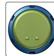
Tresiba® 200 enheter/ml