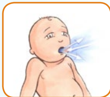
rask pusting 3