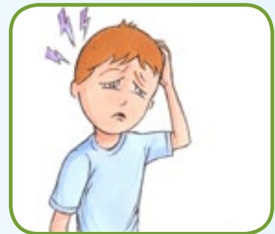
kraftig hodepine 2