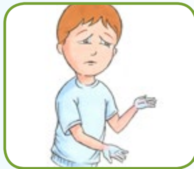
kalde hender og/eller føtter 2,4