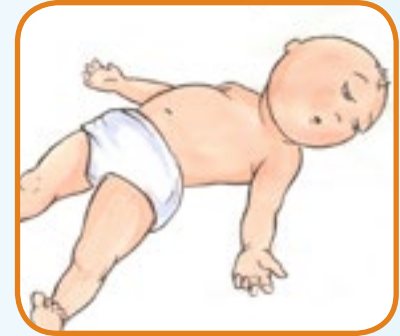
treit, slapp, reagerer dårlig 3