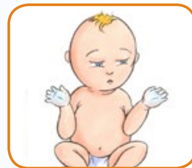
kalde hender og/eller føtter 3