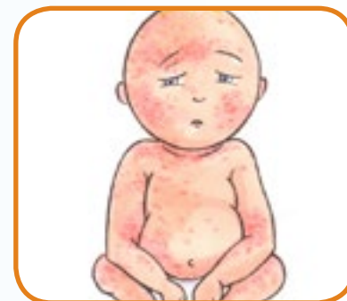
blek, flekkete hud; prikker/utslett 3