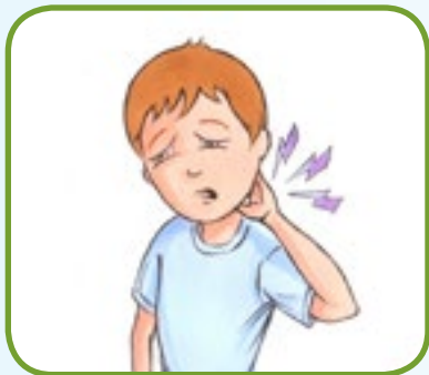
stiv nakke 2