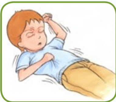
ukontrollert skjelving 2