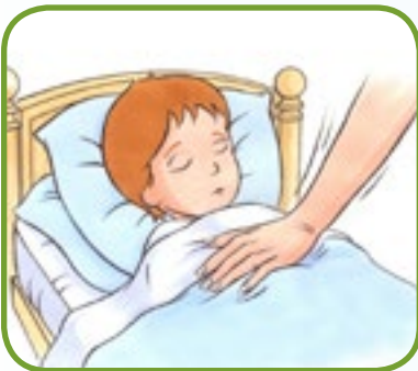
tretthet, vanskelig å vekke 2,4

Alle disse tegnene og symptomene på meningitt og sepsis oppstår ikke hos alle. Det er veldig viktig å oppsøke lege UMIDDELBART hvis du ser ETHVERT av følgende tegn og symptomer.