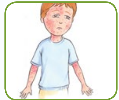
blek, flekkete hud; prikker/utslett 2,4