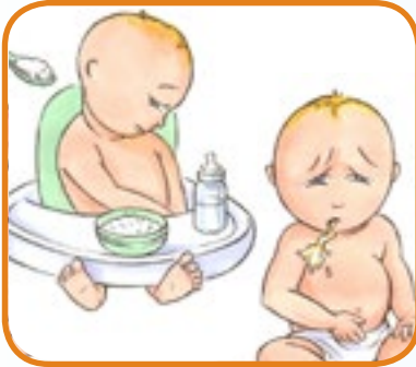
vil ikke spise og/eller kaster opp 3