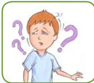
forvirring og irritasjon 2,4,5