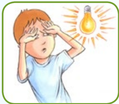
liker ikke skarpt lys 2