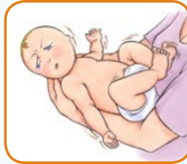
liker ikke å berøres 3