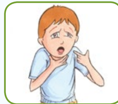
problemer med å puste 2,4