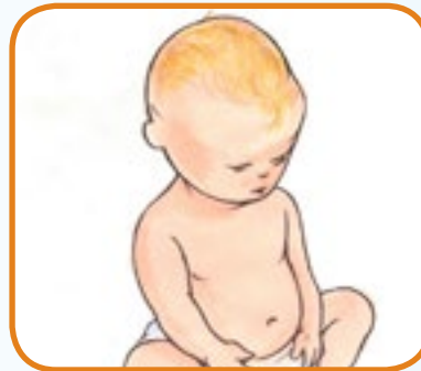
ømhøt eller hevelser på det vanligvis myke punktet på hodet 3

Alle disse tegnene og symptomene på meningitt og sepsis oppstår ikke hos alle. Det er veldig viktig å oppsøke lege UMIDDELBART hvis du ser ETHVERT av disse tegnene og symptomene: