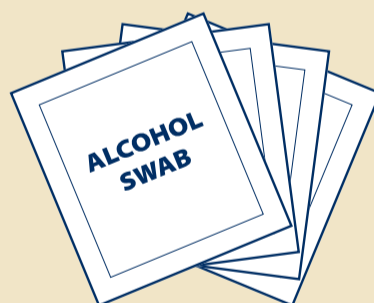
F Eske med spritservietter (x4)