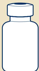
A Hetteglass med legemiddel (1)