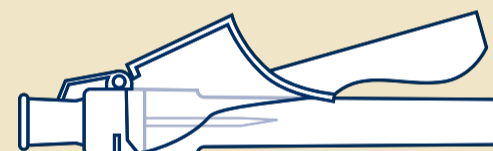
D Sikkerhetskanyle: 27 G*, 13 mm (1)