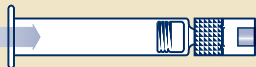
B2 Ferdigfylt sprøyte med sterilt vann (1)