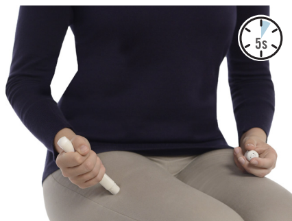
Trykk mot låret, og det høres et klikk. Hold i 5 sekunder. Masser så injeksjonsstedet. Ring 113.